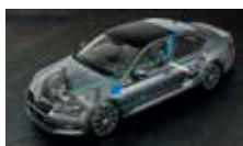
Adaptivní podvozek – volitelné nastavení podvozku ve 3 režimech (Comfort, Normal, Sport)

ŠKODA usnadňuje život svým zákazníkům každý den.