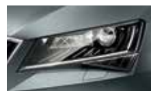
Smart Light Assist – automatické přepínání a clonění dálkových světel