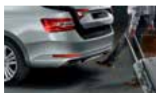
Virtuální pedál – bezdotykové otevírání 5. dveří